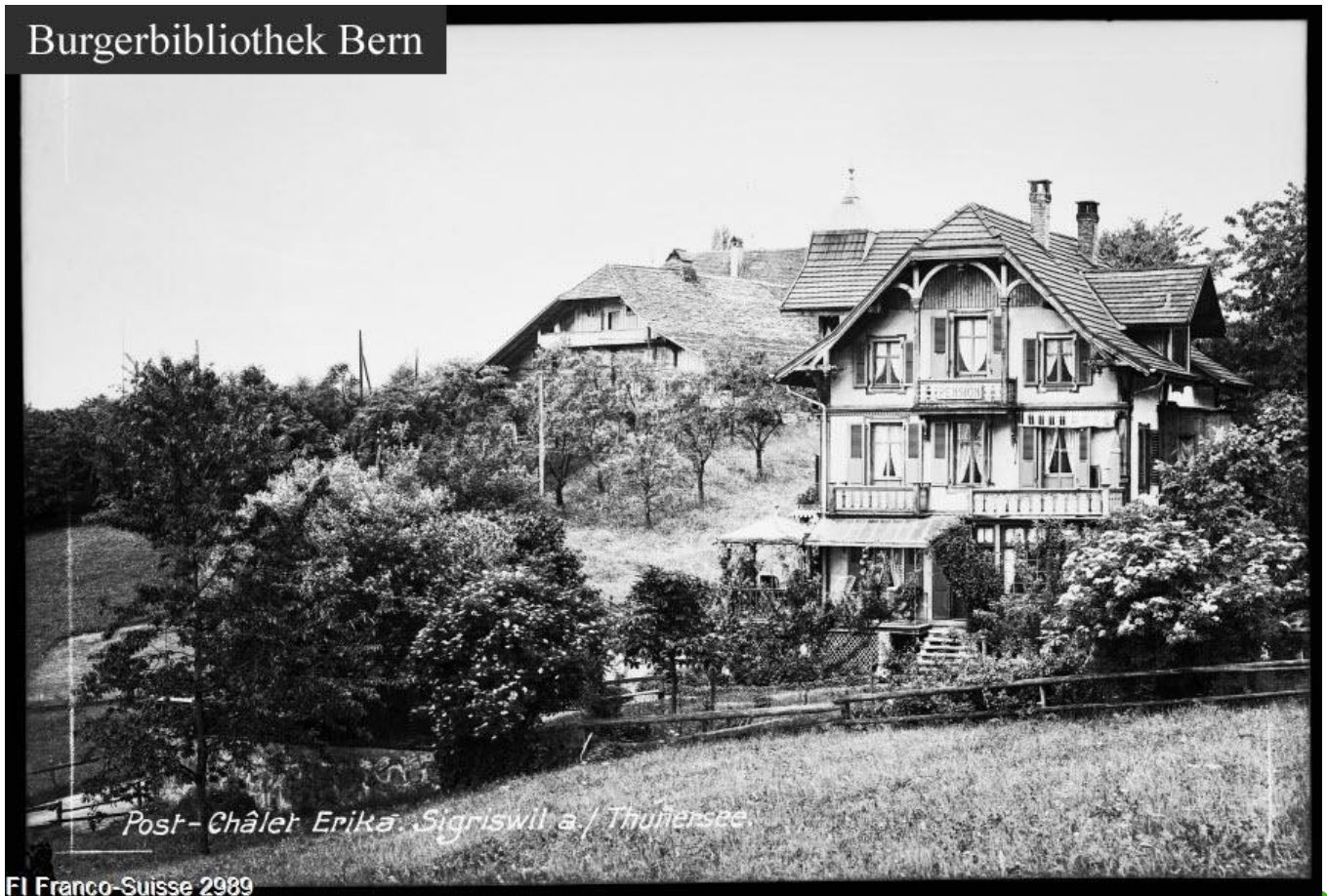
FI Franco-Suisse 2989